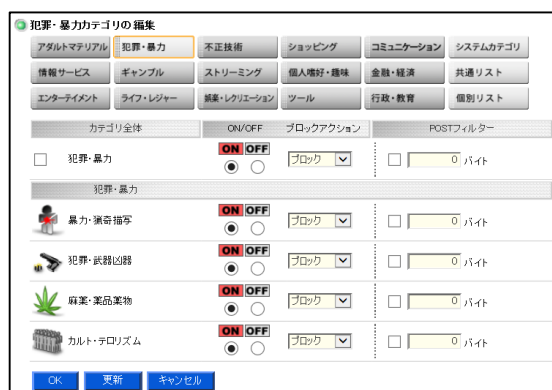
図 2 設定画面例(暴力・猟奇描写)