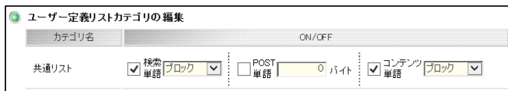
図 4 共通リスト 使用設定画面例

※上記設定後、キーワードを追加する場合は、手順「1」から「3」を行ってください。「5」から「9」の手順は必要ございません。