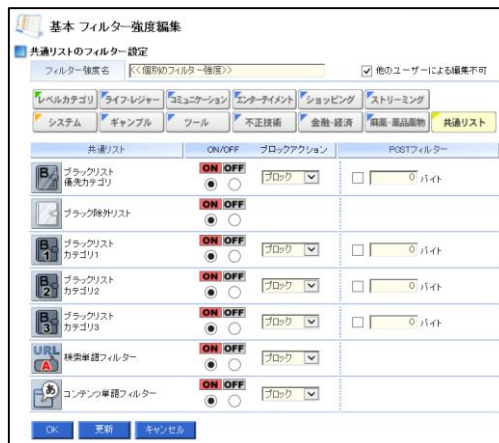
図 4 共通リスト 使用設定画面例