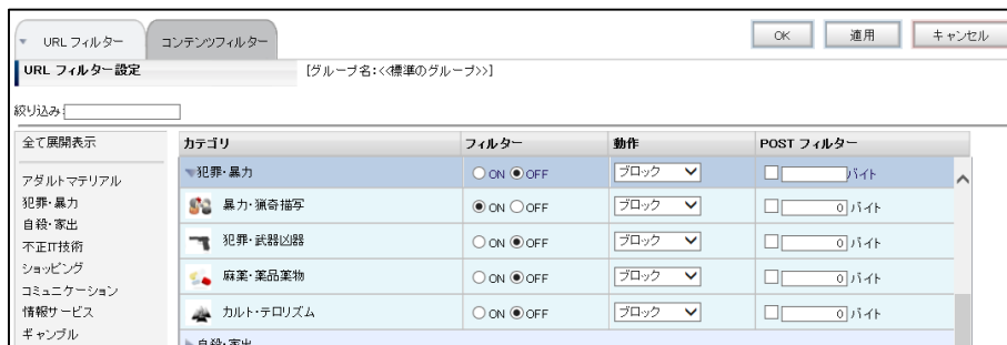
図 2 暴力・猟奇描写 設定画面